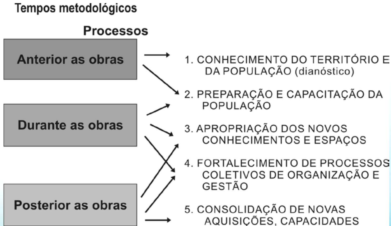
Figura 06: Tempos metodológicos do trabalho social