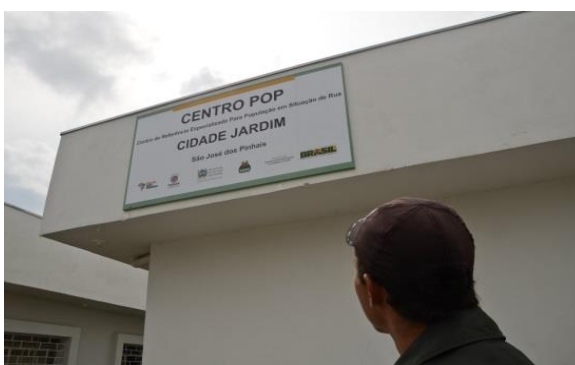
Município de São José dos Pinhais/PR

DESCRIÇÃO: Unidade pública estatal de referência destinada ao atendimento especializado à população de adultos e famílias em situação de rua, proporcionando vivências para o alcance da autonomia e estimulando a organização, a mobilização e a participação social, por meio da oferta obrigatória nessas unidades do Serviço Especializado para Pessoas em Situação de Rua. O Serviço Especializado em Abordagem Social, que tem por finalidade assegurar trabalho social de abordagem e busca ativa, também pode ser referenciado neste equipamento.