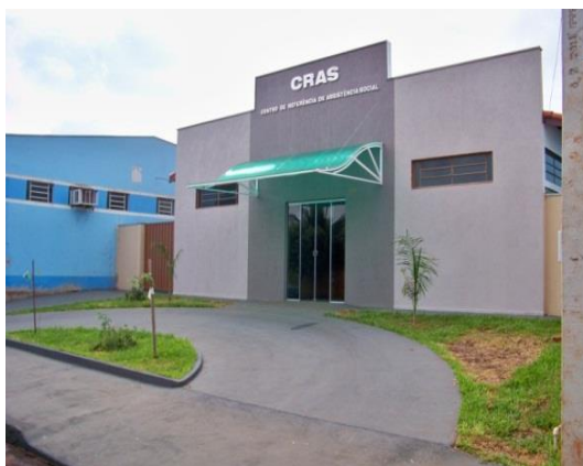
Município de Aramina/SP

DESCRIÇÃO: Unidade pública municipal, de base territorial, responsável pela organização e oferta de serviços da proteção social básica do SUAS. Possui interface com as demais políticas públicas e se caracteriza como a principal “porta de entrada” do SUAS, possibilitando, assim, o acesso das famílias e indivíduos à rede de proteção social de assistência social.