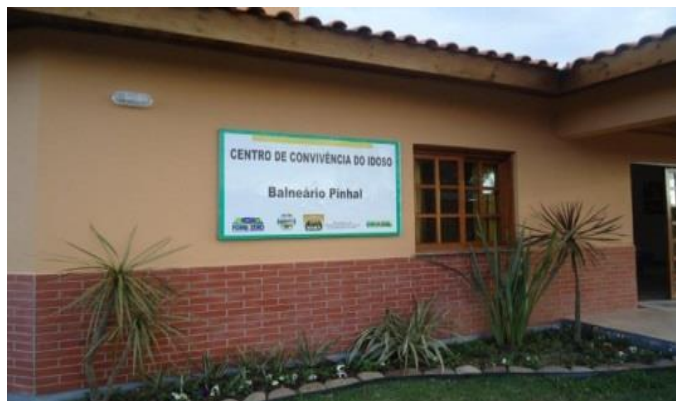
Bañeário do Pinhal/RS

DESCRIÇÃO: Unidade pública, referenciada a um CRAS, destinada ao desenvolvimento do Serviço de Convivência e Fortalecimento de Vínculos de acordo com o perfil sócio-demográfico dos territórios e considerando o atendimento de situações prioritárias (em situação de isolamento; trabalho infantil; vivência de violência e/ou negligência; fora da escola ou com defasagem escolar superior a 2 (dois) anos; em situação de acolhimento; em cumprimento de medida socioeducativa em meio aberto; egressos de medidas socioeducativas; situação de abuso e/ou exploração sexual; com medidas de proteção do Estatuto da Criança e do Adolescente - ECA; crianças e adolescentes em situação de rua; vulnerabilidade que diz respeito às pessoas com deficiência).