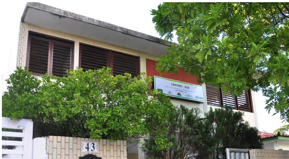
Município de João Pessoa/PB

DESCRIÇÃO: Equipamento da proteção social especial de média complexidade destinado à realização do serviço de proteção social especial para pessoas com deficiência, idosas e suas famílias, cujos cuidados não possam ser dispensados no domicílio ou em outros serviços da rede. O serviço ofertado no Centro Dia deverá buscar a diminuição da exclusão social tanto do dependente quanto do cuidador, a sobrecarga decorrente da situação de dependência/prestação de cuidados prolongados, bem como a interrupção e superação das violações de direitos que fragilizam a autonomia e intensificam o grau de dependência da pessoa com deficiência ou pessoa idosa.