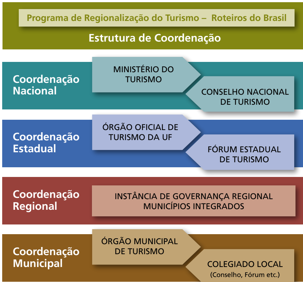
Figura 1 – Estrutura de coordenação do Programa de Regionalização do Turismo – Roteiros do Brasil

Para facilitar a compreensão e a assimilação dessa estrutura de Coordenação, vejamos a figura a seguir.